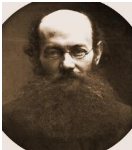
Peter Kropotkin (1842-1921)

Diese Ansätze beruhen durchweg auf der Ablehnung kapitalistischer Wirtschaftsformen, die sowohl die menschliche Arbeitskraft, als auch die natürlichen Ressourcen als vernutzbare Kostenfaktoren betrachten, aus denen es höchstmögliche Gewinne zu erzielen gilt. Aus dieser Perspektive sind auch heute noch sämtlich Ansätze eines irgendwie gearteten „Green Deals“ zum Scheitern verurteilt, denn sie tasten die ungerechte Verteilung der Verfügungsrechte und des gesellschaftlichen Reichtums nicht an, sondern garantieren die Gewinne der Kapitalseite und zementieren ihre Herrschaft über die menschliche Arbeitskraft und die natürlichen Ressourcen zugleich.