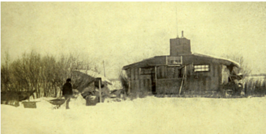
Die Naturschutzwarte „Mönne“ im Jahre 1926.