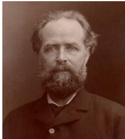
Elisée Reclus (1830-1905)

Um den Herrschaftssystemen ihrer Zeit Alternativen entgegenzustellen, studierten die beiden – zu ihrer Zeit allgemein hochgeschätzten – Geographen Elisée Reclus (1830-1905) und Peter Kropotkin (1842-1921) das Leben indigener Bevölkerungen und deren naturräumliche und biologische